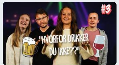
Hvorfor drikker du ikke?