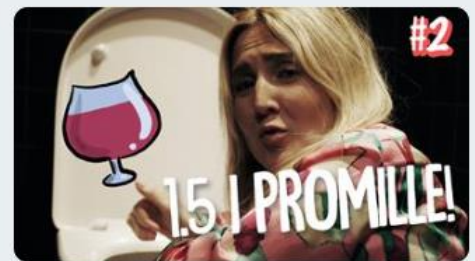
1,5 i promille