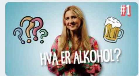
Hva er alkohol?