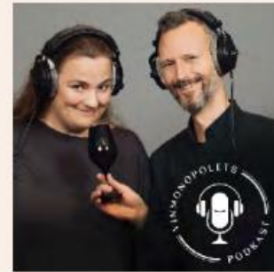
Vin til julemat Vinmonopolets podkast